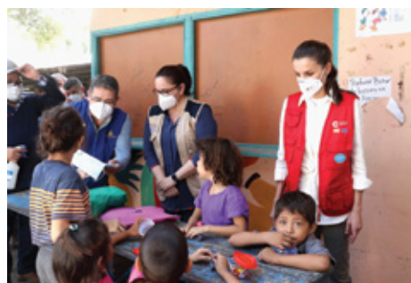
Fotografías y texto © Casa de S.M. el Rey

Al impacto de la pandemia en Honduras se ha sumado la catástrofe climática de Eta e Iota, que ha afectado al 40 por ciento de la población y ha dejado medio millón de evacuados, cien mil personas hacinadas en albergues, la mitad de estudiantes sin conexión a internet, un centenar de fallecidos, 330.000 personas incomunicadas y el motor económico del país, San Pedro Sula, arrasado.