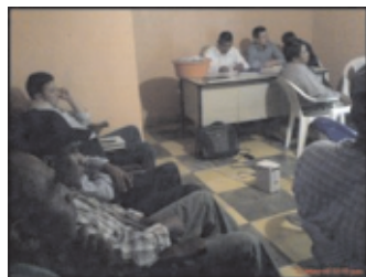
Socialización de la iniciativa Agendas DEL en reunión de Corporación Municipal en los municipios de Yarula y Santa Elena.