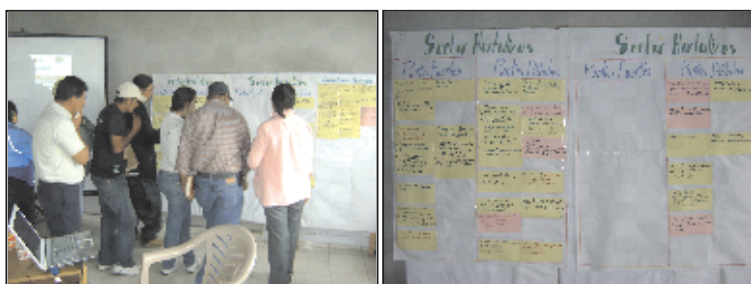
Izg.: Participantes de sectores productivos en la evaluación participativa de la competitividad, Der: Matriz de recolección de la información.

Posteriormente en otro evento se reúne a todos los involucrados para identificar acciones a corto plazo, realizando jornadas de trabajo para cada sector, analizando e interpretando los contenidos; se aportaron medidas ó recomendaciones conforme a los recursos sus disponibles, apoyados de una matriz para poder registrar y documentar el proceso (Realistas, con recursos propios, efecto a corto plazo).